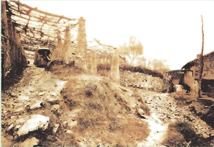
Un txakoli barroko batzuk, eta beste batzuk errenbaturatuak. Irudiak erakusten duen txakoli bakoitzak bere berezitasunak ditu. Irudiak erakusten duen txakoli bakoitzak bere berezitasunak ditu.

Biztariako mahats-parrak Urdaibaiako Mendebaldeko Mendietan elementu etnografikoa dira. Mahatsaren laborantzerako tradizio-elementu horiek azpiztituak dira, XVIII. mendearen gutxiengatik. Antzeri denez, mahats-parrak antzerkitasun-erakundearen bidez auzolanean eraikitzen dira, "el antzerkitasun" ezagutuz. Urte askotan Biztariako herriak bidea gabekoak egiten ziren herrietan egoten ziren. Mahats-parrak egiten hasi ziren, XIX. mendetik Urdaibaiako eskualdeko ezberdinak izateko arazo mahats-parrak laborantzan oinarritutakoak izan zirela.