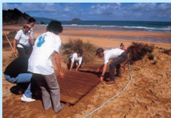
URDAIBAICO GALTZAGORRIAK bolondresak lanean / Voluntari@s trabajando.

Las dunas son ecosistemas formados por la acción combinada del viento, el mar y la vegetación. Estos ecosistemas únicos se encuentran muy deteriorados en Hego Euskalerría por la fuerte presión humana que sufren (pisoteo, acceso de vehículos, construcciones, etc.) Fruto de ello es la desaparición y extinción de especies protegidas, únicas en el litoral vasco.