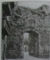
San Juan portala

La villa de Bermeo goza de gran número de monumentos y reliquias, únicas en muchas ocasiones como puede ser el caso del "Arco de San Juan" que data de tiempos de Alfonso XI o del "Claustro de San Francisco" que es el convento más antiguo de Bizkaia. Esperamos que el itinerario os sea de gran ayuda para poder conocer mejor esta villa marinera