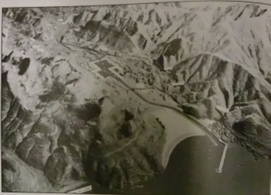
Gráfico n.º 2: Maqueta de cómo quedaría la cuenca de Urdaibai, de haberse llevado a efecto el proyecto del «Plan Especial de Aprovechamiento de la Ría de Mundaca». Año 1960.