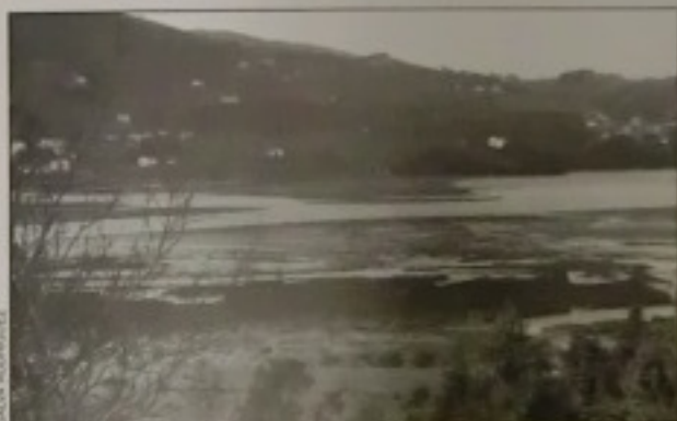
Un detalle de la marisma

Desde la creación de la Reserva de la Biosfera, el Taller de Ecología de Gemika (Txepetxa) se ha mostrado defensor de la Ley de Protección de la Reserva. Ahora bien, esta postura de defensa no significa que los miembros del Taller no sean críticos con ella: «A la hora de hacer la Ley no se ha tenido en cuenta a sectores implicados, como a los baseritarras o arantzales». En su opinión es una Ley con términos excesivamente técnicos, debatida y aprobada solamente por los políticos.