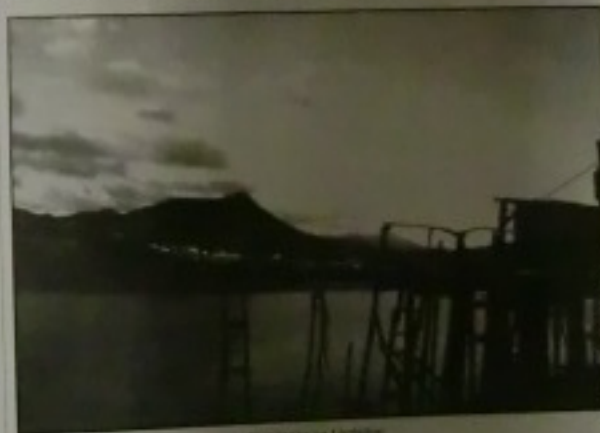
Atardecer en Urdabai